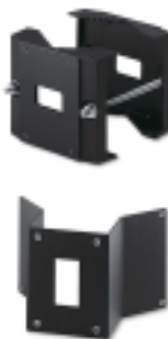
Adaptateur Poteau / Angle