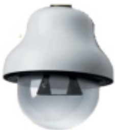
Ref : 0407 0000 Caisson Extérieur