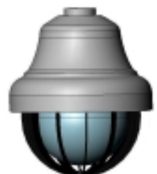
Ref : NC Grille anti vandale

Mardel Image – SAS au capital de 314 280 euros