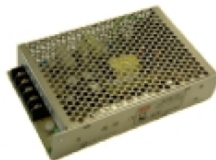
Ref : 5050 0013 Alim 220v/12v DC